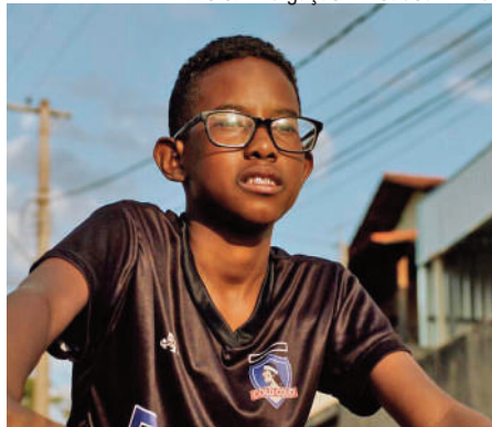
Cícero tinha 13 anos na época das gravações

pois ia até às 18h. Foi bastante cansativo, mas valeu a pena”.