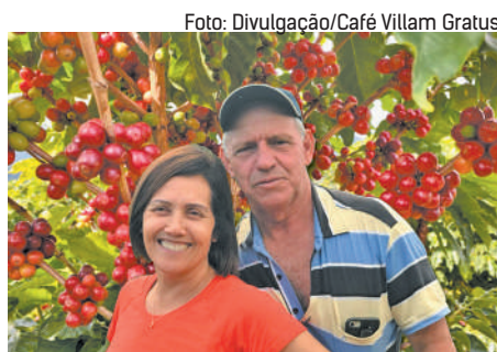
O Café Villam Gratus é fruto de muito trabalho

a condução e o manejo das lavouras, além da nutrição das plantas para que se desenvolvam saudáveis e resistentes. Isso contribui para a qualidade dos grãos”. Em razão do terreno montanhoso, a colheita é manual, o que permite maior controle e cuidado na preparação e seleção dos grãos. A torra, artesanal, valoriza o sabor do café e é feita em lotes menores. “Por isso, o nosso produto chega mais fresco