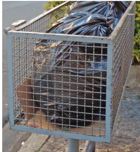
O lixo deixado fora do horário acaba rasgado

prios moradores desçam e ponham o lixo no horário correto. Infelizmente, sabemos que é difícil haver uma mudança nesse sentido. Os comerciantes, por sua vez, nem sempre têm espaço para guardar por uma semana os recicláveis, que vão para o lixo comum todos os dias.